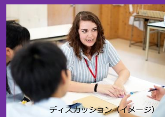
ディスカッション (イメージ)

このプログラムは、 2021年に全国で 180 校以上の中学・高校で実施され、 約 10,000 人の生徒が参加しました。