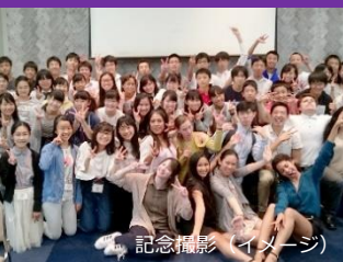
記念撮影 (イメージ)

このプログラムは、 2021年に全国で 180 校以上の中学・高校で実施され、 約 10,000 人の生徒が参加しました。